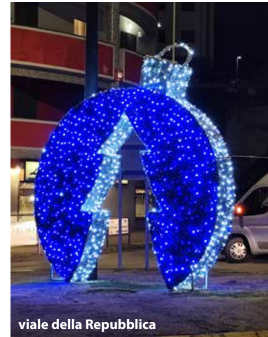
viale della Repubblica