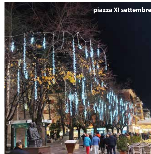
piazza XI settembre

“Abbiamo illuminato la “Città del Natale”, e non solo, abbiamo contribuito a sostenere il programma degli eventi durante le festività. Lo abbiamo fatto e lo faremo per la nostra comunità, grazie all’apertura ed alla sensibilità reciproca con il primo cittadino Franz Caruso, in forma scevra da ogni posizione politico/ideologica, a beneficio dell’intera cittadinanza. Abbiamo inteso esclusivamente rendere più bella ed attrattiva Cosenza, in un periodo dell’anno particolarmente importante e speciale”.