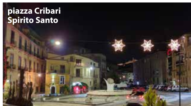
piazza Cribari Spirito Santo