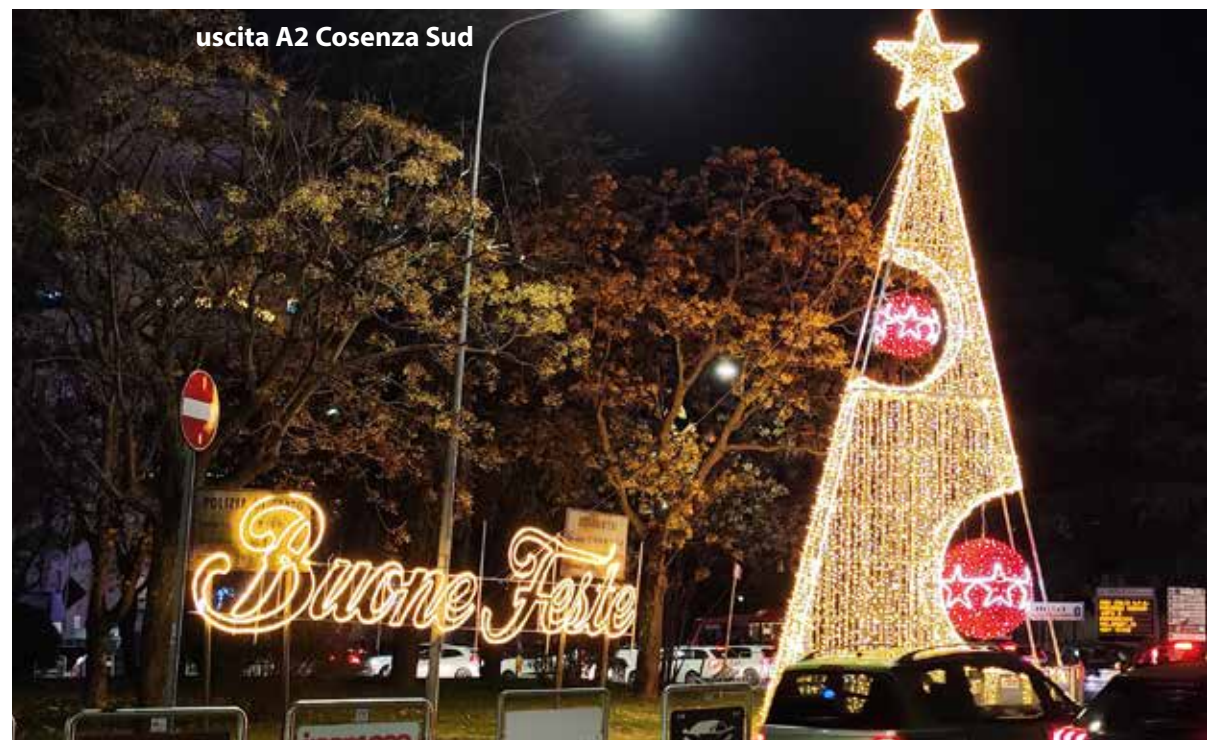
uscita A2 Cosenza Sud