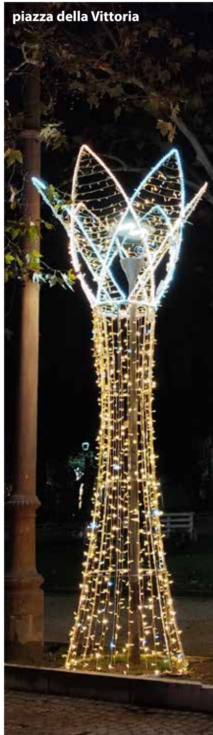
piazza della Vittoria