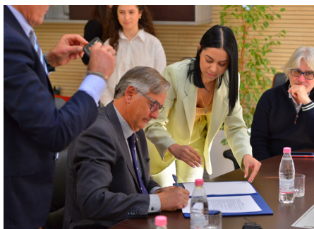
firma del protocollo d'intesa