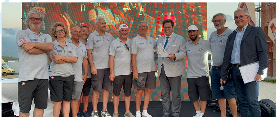
L'equipaggio dell'imbarcazione "South Breeze", vincitrice della regata 2023