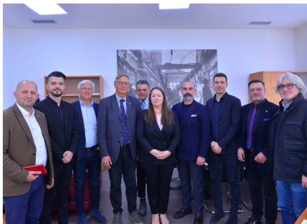
con i Vice Ministri Istruzione e Sport Albanesi